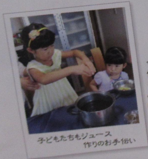
子どもたちもジュース 作りのお手伝い

今日は自家製しそを 使って「しそジュース」 を作ります。 みんなで夏バテを のりこえよう！