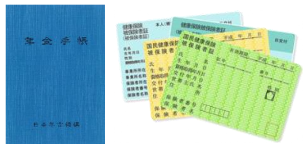
【公的機関発行の本人確認書類のコピー2種類】

※マイナンバー通知カードの裏面にご住所や氏名の変更などの記載がある場合は、必ず裏面のコピーも貼り付けください。