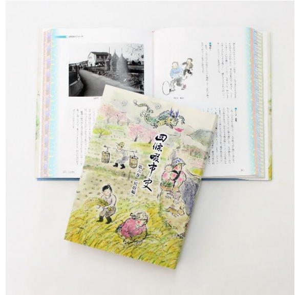
四條畷市史第六巻（民俗編）