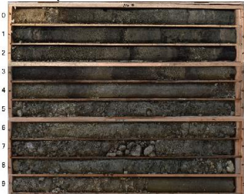
ボーリングコア写真 (m) (ボーリング No. 4)