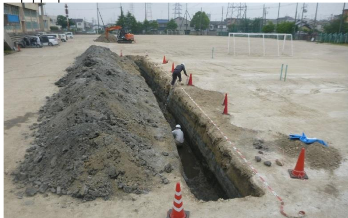
トレンチ掘削状況(トレンチ