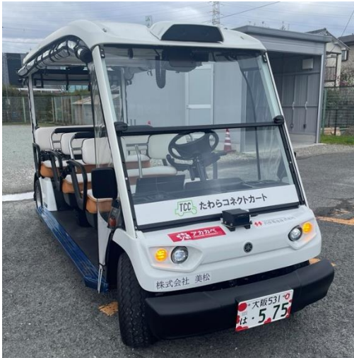
実際に走行する車