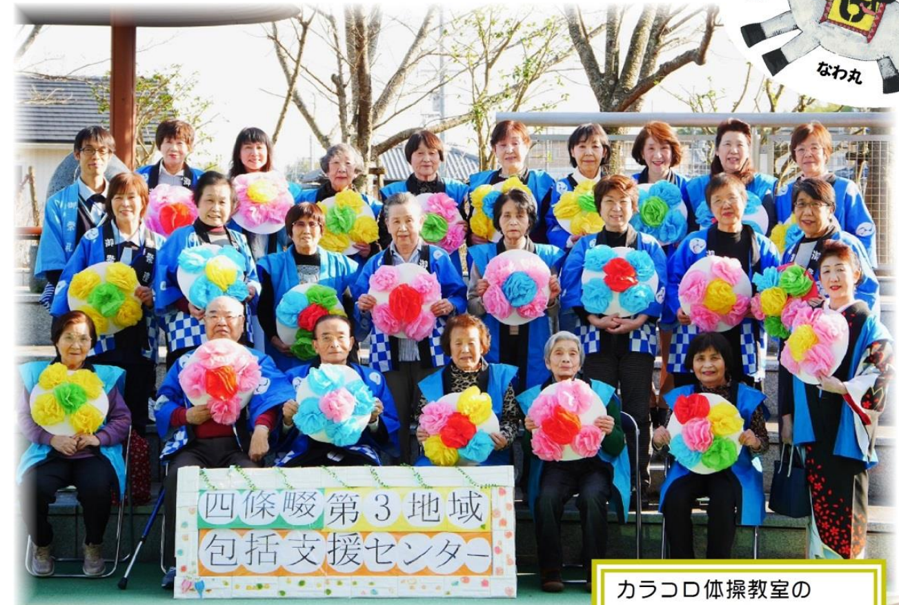
カラコロ体操教室のみなさん