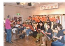
プレザント音楽団 吹奏楽演奏