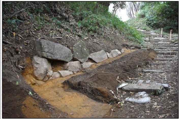
こくち 虎口に築かれた石垣