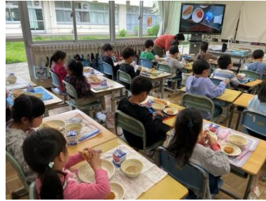
↑1年生初めての給食

4月20日(木)から25日(火)までの4日間、今年度も家庭訪問を取りやめ、保護者のお話を聞かせてもらう希望懇談という形にさせていただきました。新しい環境の中、子どもたちは学校生活がスタートしていますが、その様子を共有することができたと思います。この機会だけでなく、お子さんのことで不安を感じたり、困ったりしたことがあれば、いつでも学校にご相談ください。