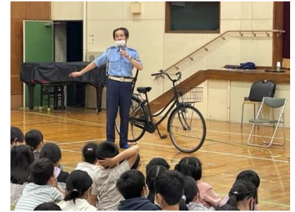
こうつうあんぜんきょうしつ ようす 交通安全教室の様子↑

しじょうなわてけいさつ かた き こうつうあんぜんきょうしつ 四條畷警察の方に来ていただき、交通安全教室 を実施しました。2時間めは1年生を対象とした信号 の渡り方などの歩行練習、3時間めは4年生を対象 として自転車に安全に乗るためのお話をしてもら いました。交通ルールを守って、登下校や放課後など、安 全な生活を送りましょうね。