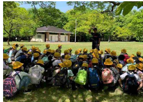
↑ 4年生 5月1日山田池公園