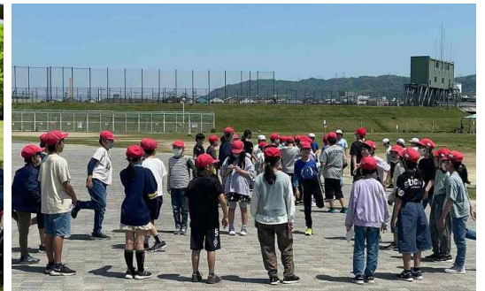
↑ 5年生 5月2日花園中央公園